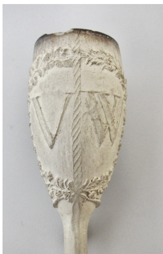
Afb.3. Een simpele Goudse pijp met VW, gevonden bij Langestraat 115/117 (93LANBP1).