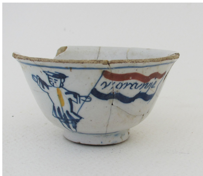
Afb.14. Delfts thee- of koffiekopje met vlaggende orangist, 18de eeuw, gevonden bij een scheepswerf bij de Schermerweg/Jaagpad (04SCHW25).