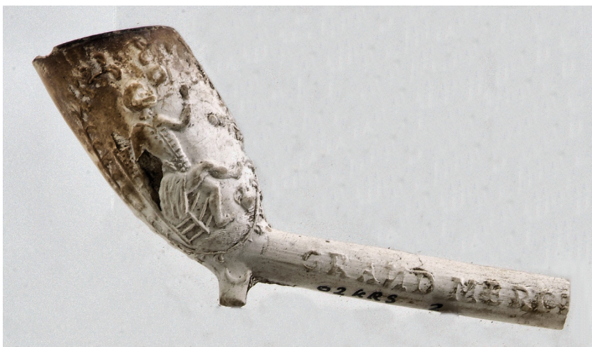
Afb.13. Spotpijp met zittende aap en de teksten GRAND MERCI ... en A VOUS KEES ... (er ontbreekt nog tekst) op de steel, gevonden achter Koorstraat 59 (02KRS2).