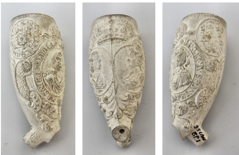
Afb.4a-c. Fraaie pijp met Willem IV en zijn vrouw, uit Langestraat 115/117. Hij heeft het Goudse merk Hollandse leeuw in tuin (93LANBP1).