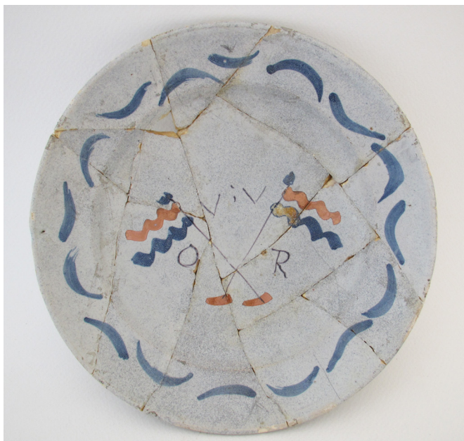
Afb.2. Een oranjegezd bord van faience, tweede helft 18de eeuw, gevonden bij Langestraat 73 (97LAN97BP5).