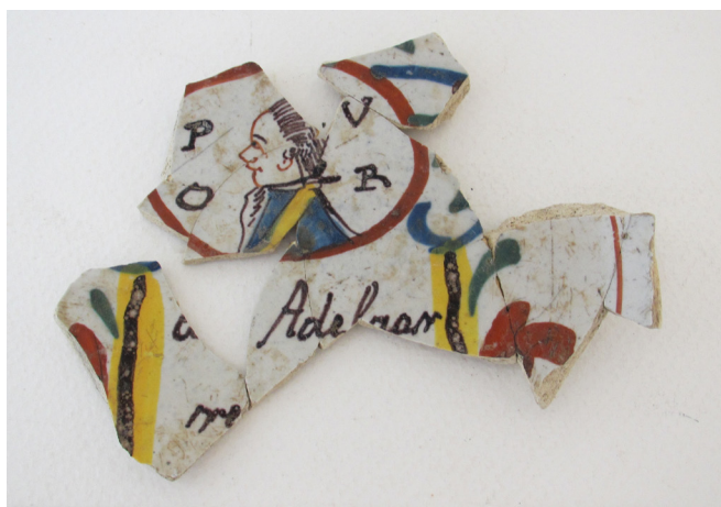
Afb.8. Fragmenten van een bord met prins Willem V als lid van de Pruisische Orde van de Zwarte Adelaar, wellicht in of kort na 1788, gevonden bij Koningsweg 31 en 29 (03KWE39BP3).