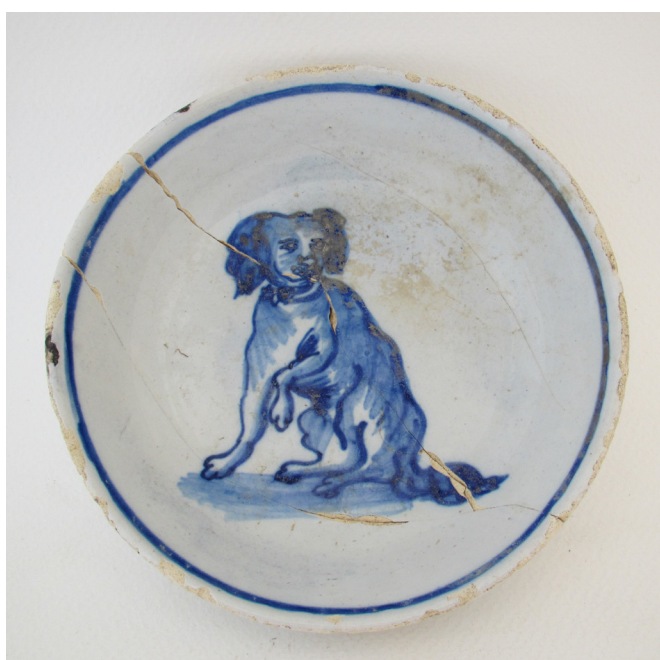
Afb.7. Delfts blauw kommetje met een fraaie waakse keeshond, eind 18de eeuw, uit de achtertuin van Laet 221 (99RU11).