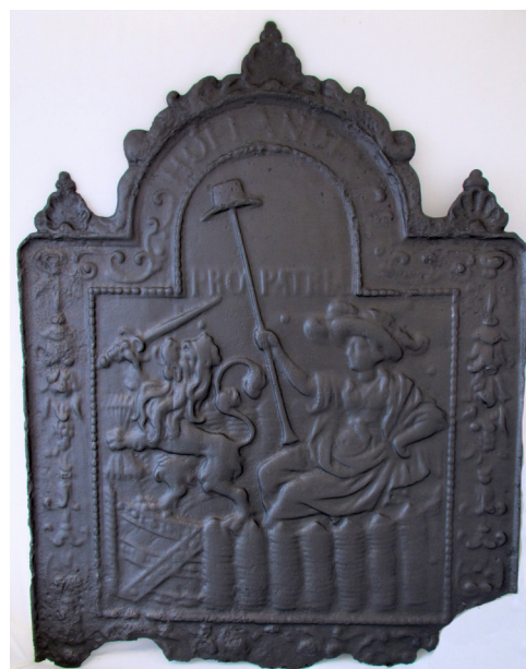
Afb.15. Gietijzeren haardplaat met de Hollandse maagd met vrijheidshoed en de tekst Hollandia Pro Patria, gevonden bij Bloemstraat 32 (06BLO).