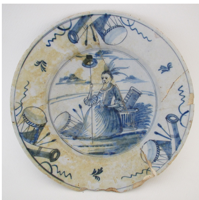
Afb.10. Delfts blauw bord van de Hollandse maagd met vrijheidshoed, trommels en kanonnen, bij Koningsweg 31 en 29 (03KWE39BP3).