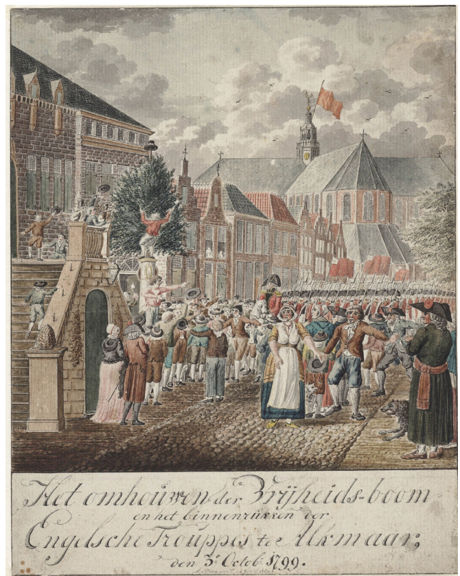
Afb. 1. Het omhakken van de vrijheidsboom na de binnenkomst van Engelse troepen op 3 oktober 1799, prent van A. Stroo. Vijf dagen later moesten de Engelsen zich terugtrekken, wat op 8 oktober (!) 1800 uitbundig werd herdacht.

Binnen de sociale top was er een machtsstrijd tussen familiegroepen, de 'facties'. Dat was een algemeen verschijnsel. Op een hoger plan waren er ook tegenstellingen in de landspolitiek. Er waren partijen die de Oranjes als regeringshoofd wensten (de orangisten) en partijen die dat juist niet wilden (de 'Staatsen', eind 18de eeuw 'Patriotten'). De rol van stadhouder, meestal bijna vanzelfsprekend toebedeeld aan de prins van Oranje-Nassau, werd bij erfopvolgingen door Holland een paar maal niet gehonoreerd. Zodoende waren er perioden zonder formeel, oranje staatshoofd: het Eerste Stadhouderloze Tijdperk was in 1650-1672, het Tweede in 1702-1747. De politieke strijd tussen prinsgezinden en patriotten bereikte een hoogtepunt tussen 1780 en 1795. Inmiddels woedde in Amerika vanaf 1776 de Vrijheidsoorlog tegen het Britse bestuur