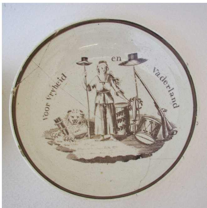
Afb.6. Laat 18de-eeuws Engels creamware schotelkje voor de Nederlandse markt, met De Hollandse maagd met vrijheidshoed, wapens en trommel en een patriottisch opschrift, gevonden achter Langestraat 57 (90BRE71BP).