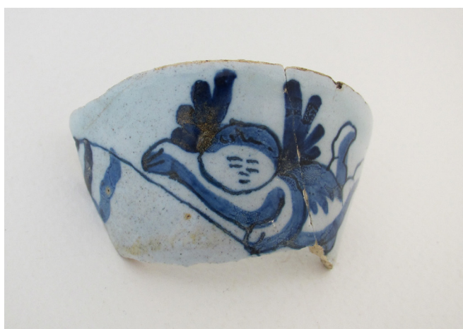
Afb.9. Fragment van Delfts blauw thee- of koffiekopje met vlaggende engel, bij Koningsweg 31 en 29 (03KWE39BP3).